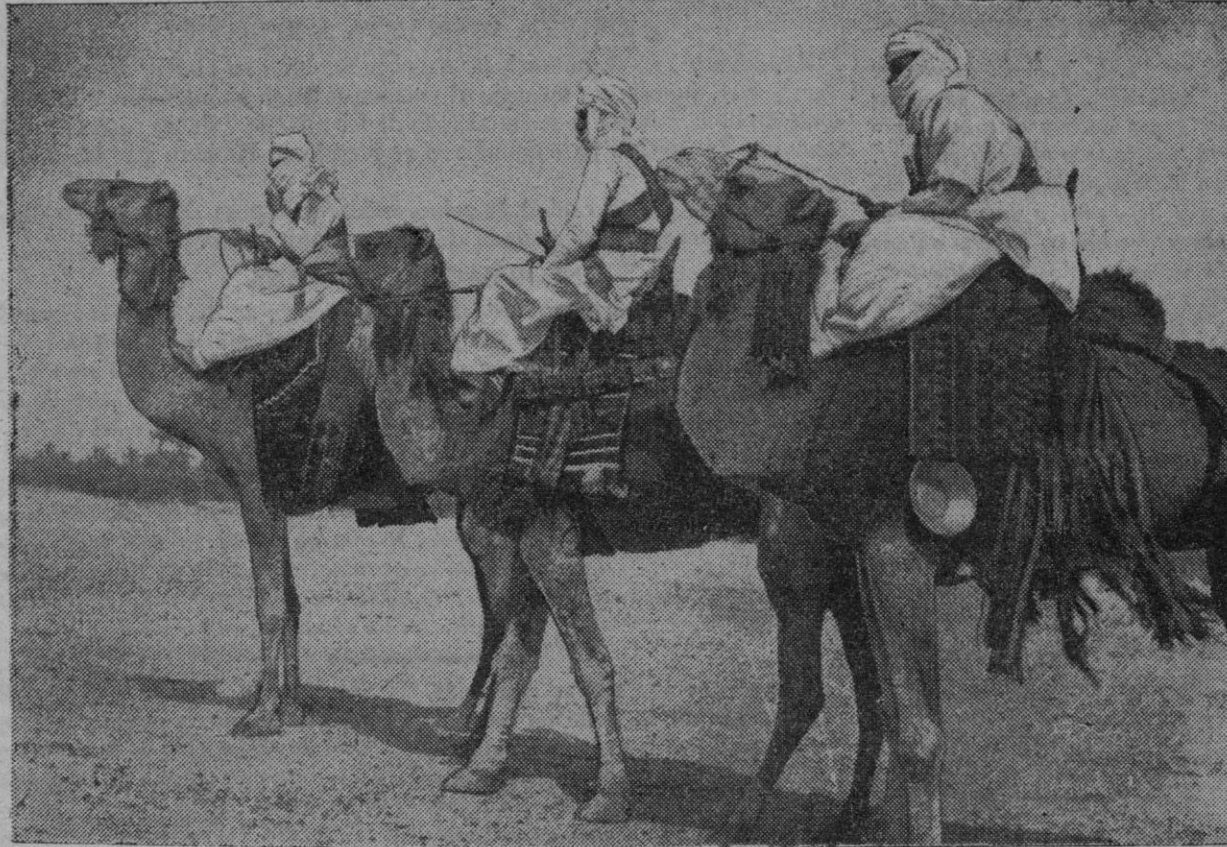
El ambiente de guerra prevalece en todo el mundo, con más o menos intensidad. La lucha está latente en Occidente y en toda su destructora y dramática realidad en el Norte. Solamente el Sur de Europa se ofrece hoy como un oasis de paz, siquiera sea aparente, entre tan terribles turbulencias. La zona sudoriental europea es, como decíamos ayer, un cúmulo de enigmas, siquiera existan esperanzas de mantenerle alejado de la contienda, pero en el Oriente lejano el peligro está latente. En éste las fuerzas aliadas se hallan dispuestas para una acción mancomunada con la que desarrollan en Europa. Sobre las ardientes arenas orientales, patrullas de camelleros montan la guardia y vigilan las inmensas regiones desérticas

Estocolmo, 11 (2 t.)—El primer ministro noruego ha publicado una proclama reafirmando la resolución de Noruega de resistir a la invasión