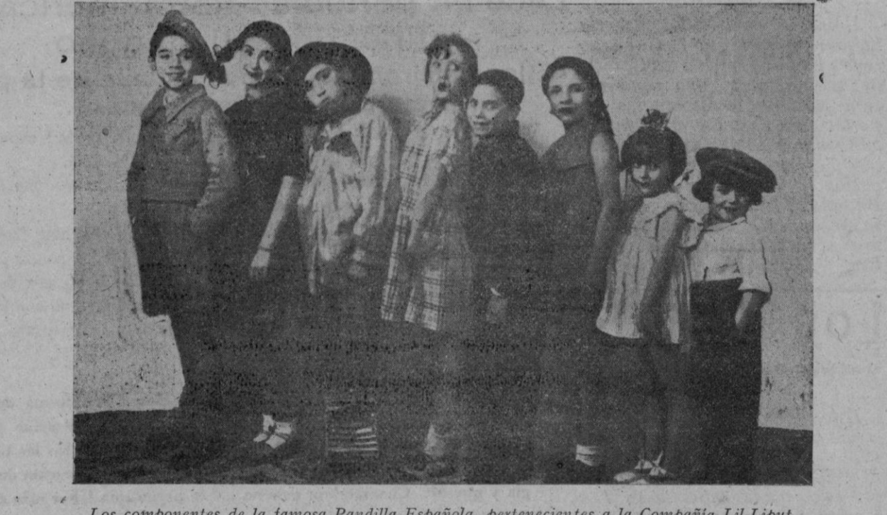
Los componentes de la famosa Pandilla Española, pertenecientes a la Compañía Lil-Liput

No se trata de niños prodigios que en son de letanía declaman y cantan sus papeles con más o menos perfección; estos notables muchachos son ya figuras eminentes del teatro por la rara perfección con que se desenvuelven en la escena. Para ellos no existe el apuntador y últimamente hemos podido presenciar en su despedida triunfal del teatro Victoria Eugenia, de San Sebastián, un caso verdaderamente asombroso: Verificaban sin apuntador la primera representación de «La Dolorosa», sin percibirse ni el más ligero bache ni la más pequeña equivocación; el público les aclamaba con frenético entusiasmo y a la terminación de la representación centenares de personas les aguardaban a la salida del teatro y al verlos aparecer los besaban y aplaudían entusiastamente, acompañándoles