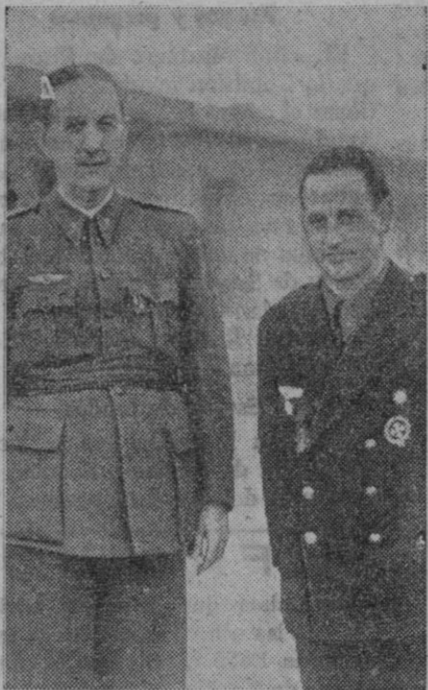
García Morato, conductor de nuestra victoriosa aviación, fotografiado, poco antes de su muerte, con el general Kin delán.

Finalizado el acto, las señoras madre y viuda de García Morato se acercaron a saludar al general Yagüe y al subsecretario del ministerio del Aire, con quienes conversaron afablemente.—Logos.