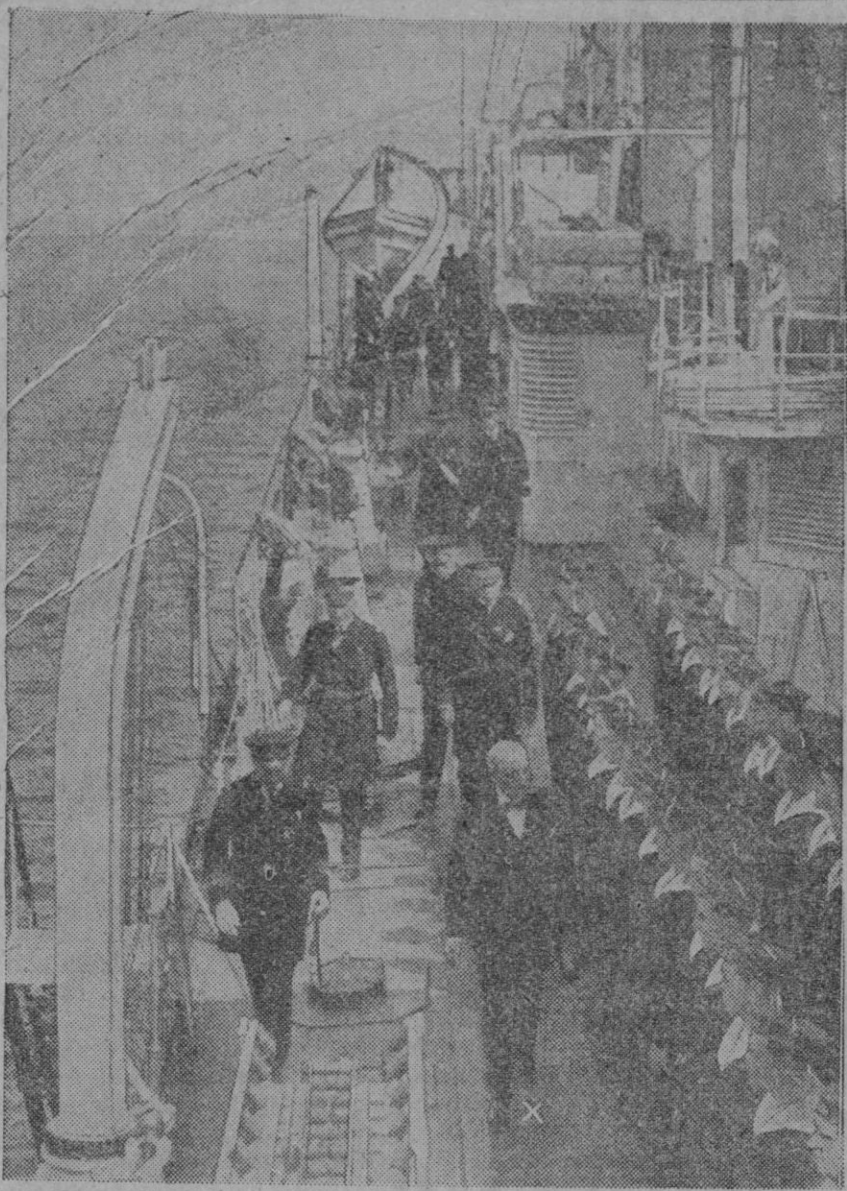
El almirante Pietri, de la flota francesa, pasa revista a la tripulación de un acorazado

Oslo, 26 (2 t.)—Ha sido publicado un comunicado oficial, en el cual se anuncia que el ministro de Noruega en Londres ha entregado al ministro británico de Negocios Extranjeros una nueva nota en relación con el asunto del «Altmark», como respuestas a las gestiones inglesas, verbales y por escrito, del 17 y del 20 del corriente mes.—Efe.