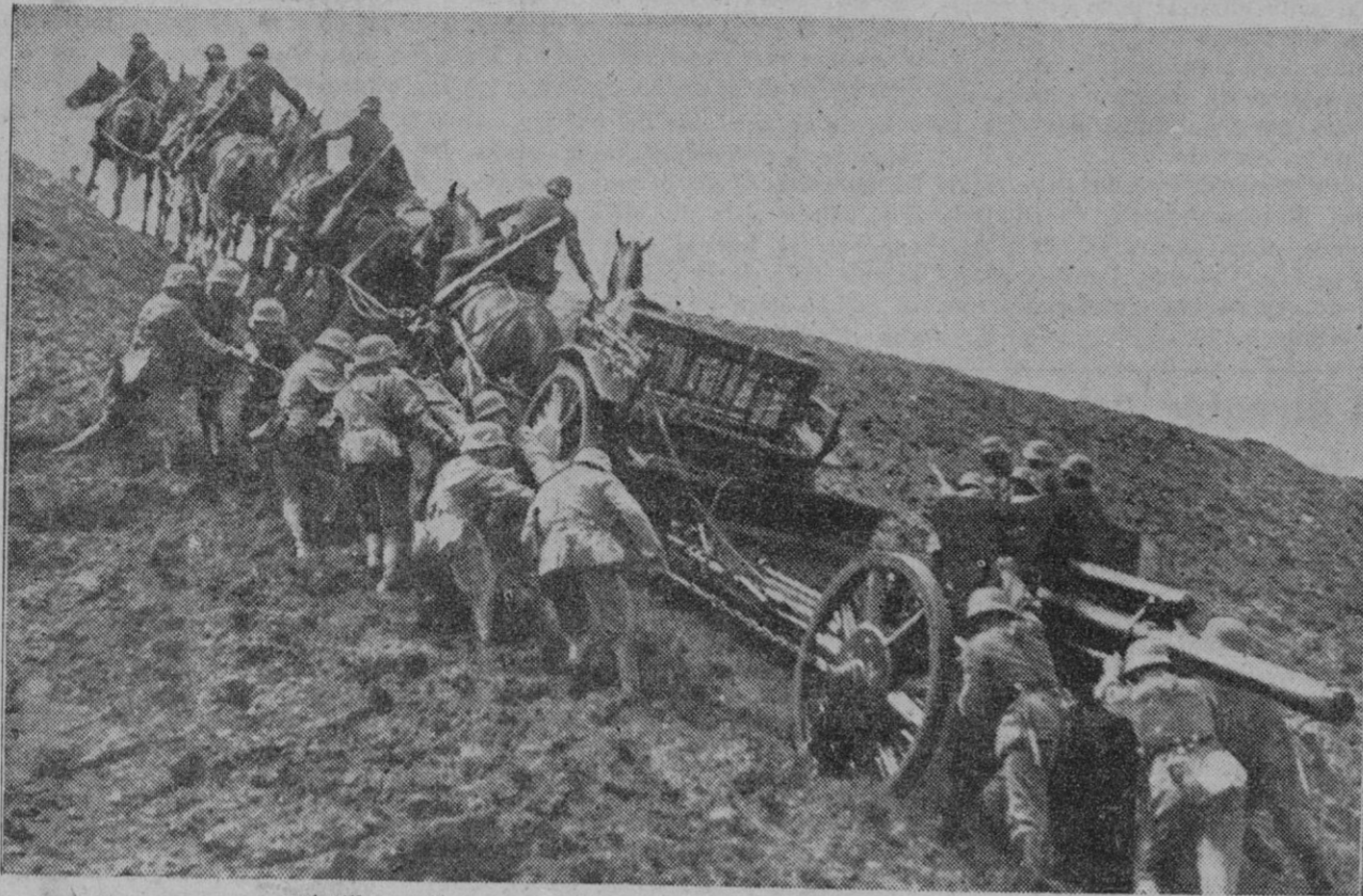
Artilleros alemanes cambiando el emplazamiento de los cañones