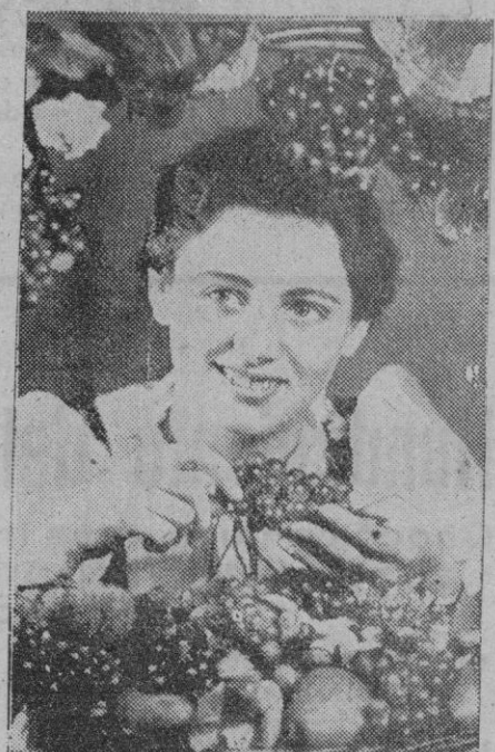
A pesar de la guerra, Alemania ha celebrado la fiesta de la vendimia. He aquí a la joven elegida reina en las fiestas de Neustadt.