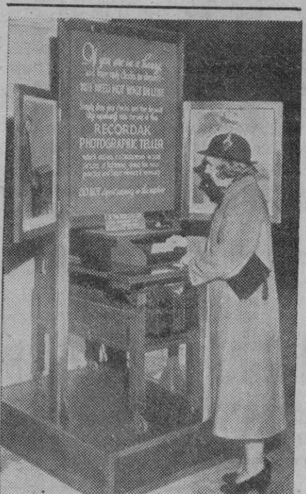
En el gran Banco americano Sterling National Bank ha quedado instalada la máquina que reproduce la fotografía, capaz de recibir hasta cien cheques por minuto. La máquina da el correspondiente cheque que fotografía al cliente.

La tripulación alemana ha sido internada en Oslo, 7 (2 t.).—Se comunica que la tripulación de presa alemana del "City of Flint", ha sido internada en la fortaleza de Kongsvinger, cerca de la frontera sueca.—Efe.