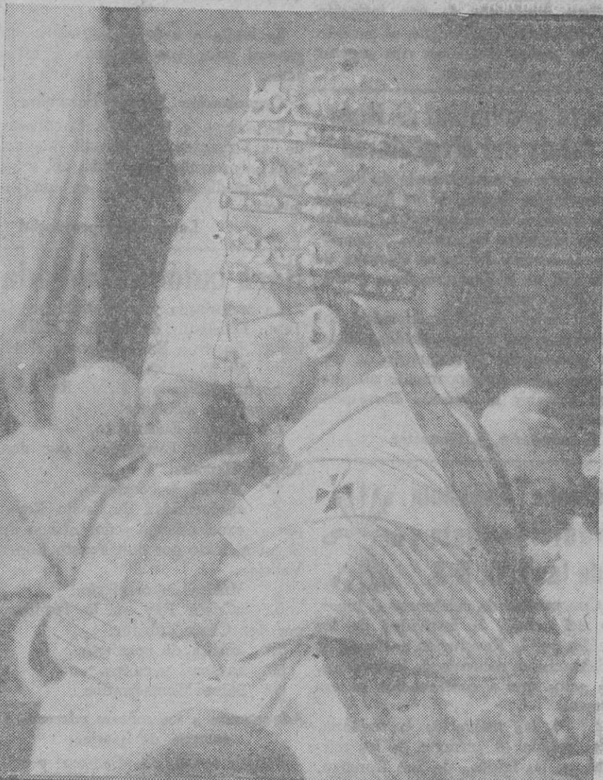
El Sumo Pontífice Pio XII, que acaba de publicar su primera enciclica

Ciudad del Vaticano, 27.—El secretario de Estado ha hecho pública la primera Enciclica de Su Santidad Pio XII.