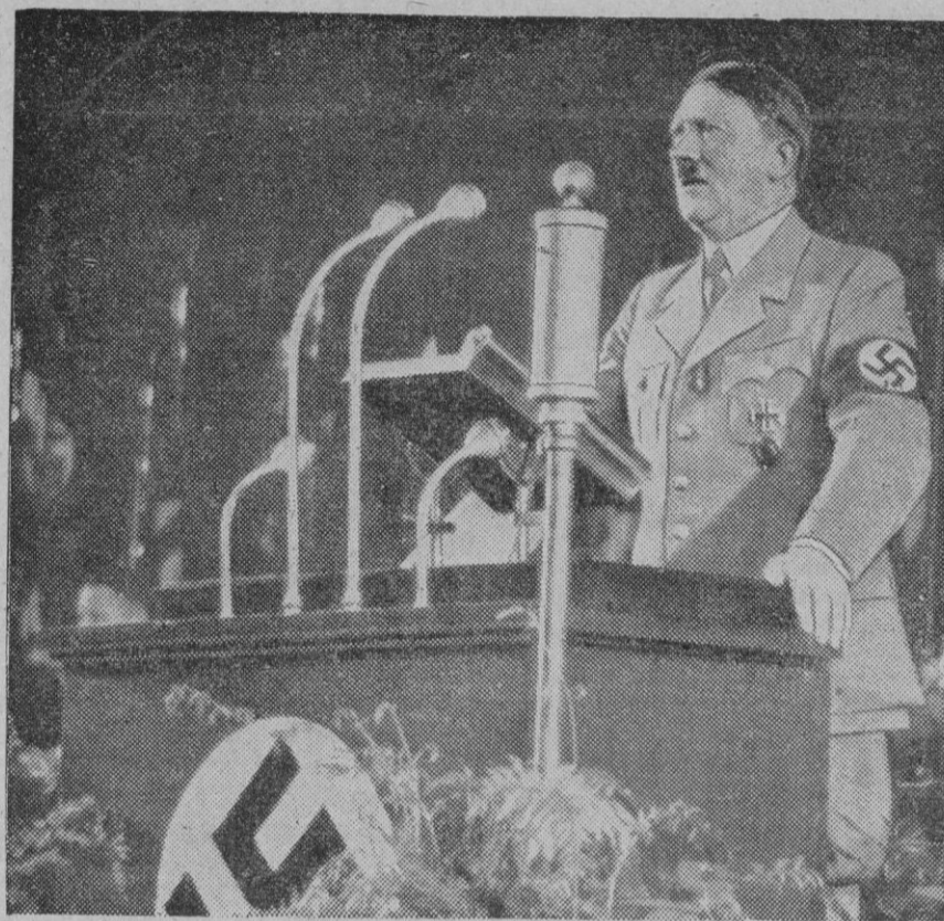
Adolfo Hitler pronunciando su trascendental discurso, que ha causado enorme sensación universal

Se refirió Hitler particularmente al hecho de que Churchill y Eden y otros políticos ingleses de la calidad de éstos lleguen a formar parte del