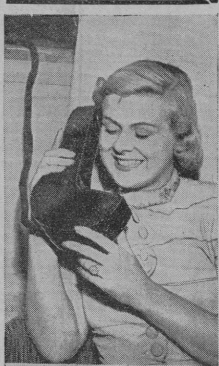
Ultima novedad en la televisión es este poste, en miniatura, que se admira en la Exposición de Londres y que tiene la forma de un micrófono, en el que se oye corrientemente, mientras que la televisión se ve detrás de una placa de vidrio en el otro extremo del aparato, sobre el cual aparecen las ilustraciones

Mañana, nuestras camaradas os ofrecerán, en cuartación pública, la Medalla del Movimiento. Comprarla y lucirla es obligación de todo buen español