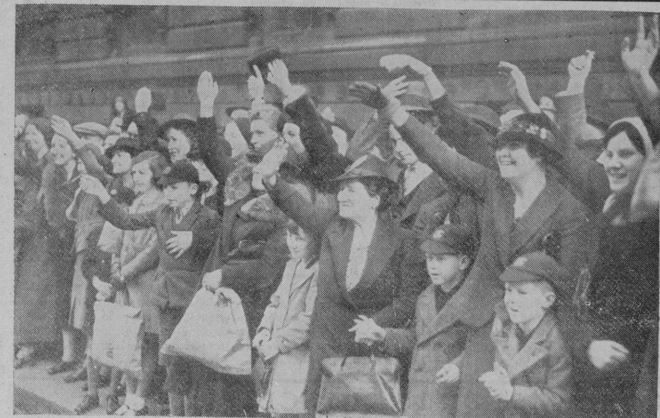
El ademán es un modo de expresar el estado de ánimo. Aquí vemos a unas damas inglesas que se han estacionado ante la Cámara de los Comunes y saludan al "premier" con un ademán que pudiéramos llamar "preludio" del saludo a estilo romano o fascista, o falangista, o nacionalsocialista. Si estas damas hubiesen esgrimido un puño cerrado... Claro es que no hay analogía entre un rostro alegre y un puño cerrado. Por eso el estado de ánimo gozoso, feliz, tiene su expresión exacta en el brazo alzado o semialzado y la mano abierta. De ahí la diferencia entre el puño comunista y la mano extendida a lo nacional. El puño indica: "Te comeré los entresijos. Ya nos encontraremos. Te hundiré el cráneo. ¡Salud y lynchamientos!". Además de otras cuantas cosas a cual menos agradables. El saludo de la mano abierta expresa lo contrario: "Es cordialidad, bienvenida, disciplina, respeto, esperanza, fe en la persona o en el símbolo a quien se dirige. Estamos seguros de que Mr. Chamberlain se ha sentido halagado con ese saludo que guarda tan estrecha analogía con el fascista. ¿Le habría gustado un remedo del puño cerrado? No podríamos contestar, porque el hombre del paraguas es una esfinge. Ayer buscaba el saludo nazi. Hoy mendiga el puñetazo soviético.