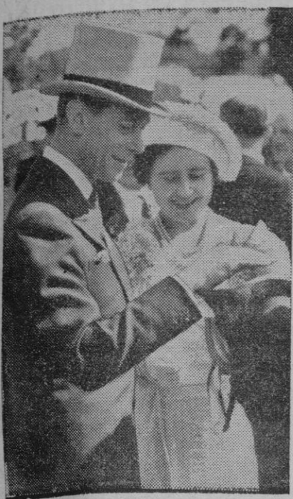
Los Reyes de Inglaterra durante una visita girada a la exposición de Agricultura en Windsor (Inglaterra)