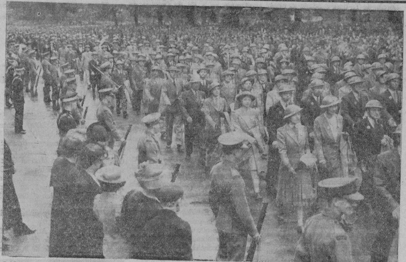
PARADA DEL EJERCITO DE LA DEFENSA CIVIL.—En Hyde Park (Londres) ha tenido lugar una demostración de 20.000 miembros de uno y otro sexo del llamado Ejército de la defensa civil. Aquí se les ve desfilando ante los Reyes Jorge VI e Isabel y la Reina Mary. Dicho Ejército cuenta millón y medio de hombres y mujeres que visten uniforme especial. Las "democracias" se "totalitarizan" en punto a organización de su masa civil. ¡Lástima que sigan el ejemplo para intentar mantener una hegemonía que se cae a pedazos!

Londres, 26.—En su edición de mediodía, "Daily Herald" asegura que después de muchas conversaciones no podrá ser concertado el empréstito pedido por Polonia.—D. R. V.