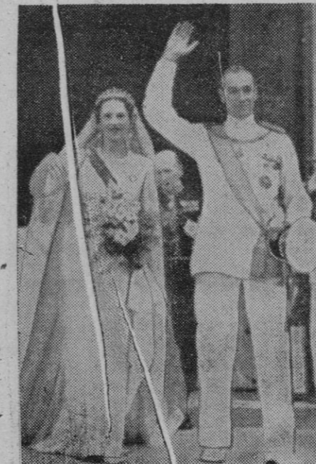
El duque de Spoleto y la princesa Irene, de Grecia, que han contraído matrimonio en la Catedral de Florencia en presencia de muchos miembros de las Casas Reales europeas. Se les ve saludando a la multitud después de la ceremonia

A las seis de la tarde las bellas gallegas han asistido a la primera corrida de feria, siendo acogidas en la plaza con ovaciones y vivas a Galicia.—Mundial.