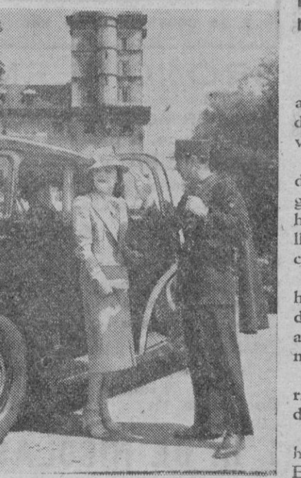
Pola Negri, la célebre estrella del cine que actualmente se encuentra en París

Una de las calles principales de Mondragón llevará desde hoy el nombre del batallador diputado defensor de las tradiciones de España, hoy victoriosas.—Mundial.