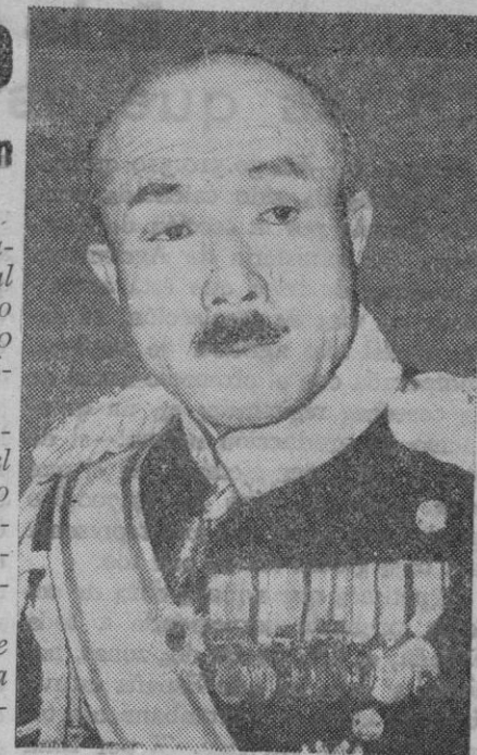
Hiranuma, ministro japonés de la Guerra

Proclama del barón Hiranuma al pueblo japonés