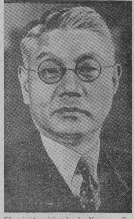
El ministro japonés de Negocios Extranjeros, señor Harita

Sevilla, 4.—Ha llegado de Málaga el delegado nacional de juveniles de Falange Española Tradicionalista, Sancho Dávila. Viene muy satisfecho del resultado de su inspección, pues ha podido comprobar el funcionamiento de todos los servicios de la organización.—Mundial.