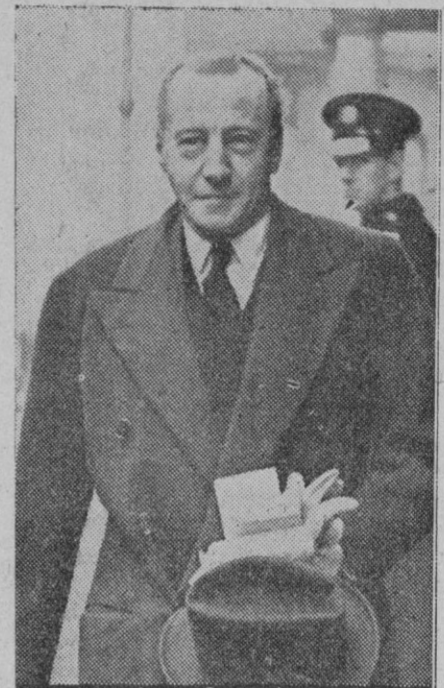
El embajador inglés en Tokio, sir Archibald Clark Herr

—¡Amos, ande, lord Lloyd! ¿A nosotros, qué nos cuenta usted? Nosotros hemos venido a pasar quince días en Gran Bretaña, honrados con la invitación del Consejo de Londres, y no nos interesa de momento que Inglaterra esté dispuesta a romperse la cara con Perico el de los palotes. Lo otro, lo de las relaciones cordiales, etc., eso está dentro del protocolo. Con éste transigimos, pero con lo otro... ¡amos, ande, no nos amargue la estancia en vuestro bello país!