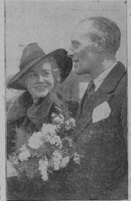
La estrella de cine Madeline Carroll ha llegado a Londres, procedente de Hollywood, para visitar su país natal. En la fotografía aparece con su esposo el capitán Phillip Astley en el momento de su llegada al aeródromo de Heston.

Refiriéndose a los esfuerzos de los políticos del acorralamiento, dan a entender que fracasarán lastimosamente por el mero hecho de que las potencias del eje pueden poner en pie de guerra más de 25 millones de hombres.—Mundial.