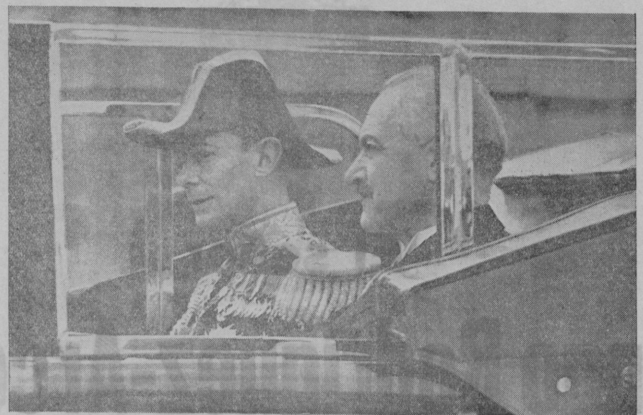
Jorge VI de Inglaterra y M. Albert Lebrun, durante la visita de este último a Londres, donde quedó trazado el plan de las "democracias" que hoy presenta perspectivas inquietantes, sobre todo para quienes le trazaron

El alto comisario será recibido hoy por Mr. Chamberlain.