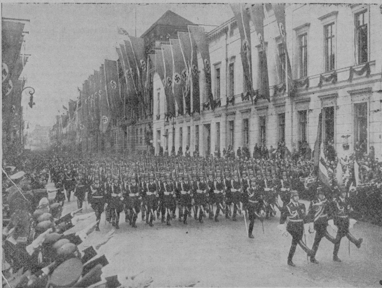
LA PARADA MILITAR DEL 28 EN BERLIN.—Formaciones de S. S. desfilan ante el Canciller (el Führer) a la recepción de uniforme, a la izquierda, en la Wilhelmstrasse con ocasión del 50 aniversario del nacimiento del fundador del III Reich