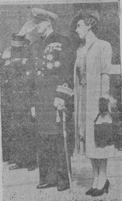
El Príncipe real Federico y la Princesa Ingrid, de Dinamarca, cuya vida ha estado en peligro al hundirse el trasatlántico en que salían de Nueva York por choque con un buque piloto

Budapest, 28.—El jefe del Gobierno húngaro, conde Teleky, y el ministro de Negocios Extranjeros del mismo país, conde Sacky, han salido para Berlín a las cinco de la tarde de hoy.