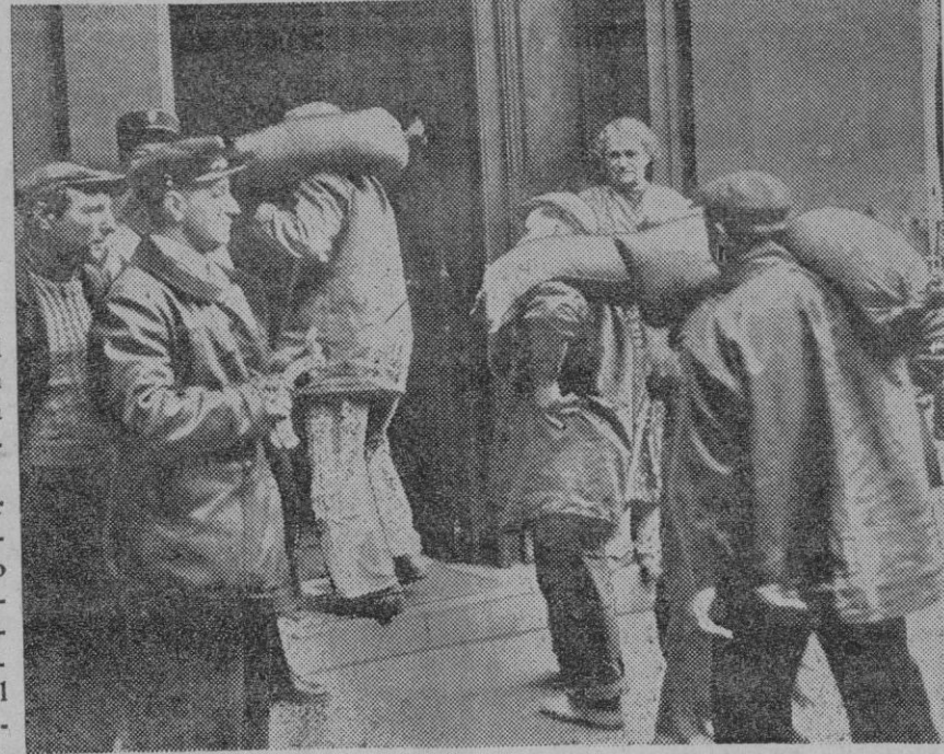
LAS MEDIDAS DE PRECAUCION EN PARIS.—Las democracias no tienen la conciencia tranquila, y por eso trabajan con asombrosa celeridad en obras de defensa de la población civil. La fotografía representa un momento del transporte de sacos terreros a una casa particular en París. Con la arena se combatirían los incendios que los bombardeos aéreos pudieran provocar