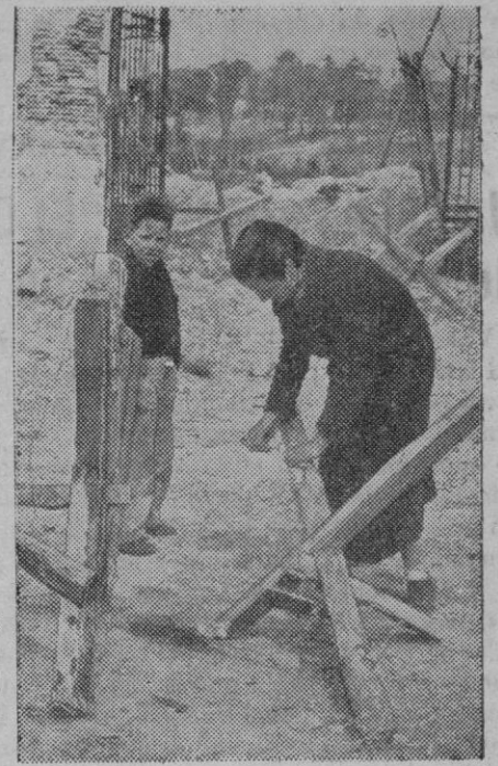
Como es sabido, una de las mayores adversidades que sufrió Madrid, durante el asedio por las invictas tropas nacionales, fué la falta de combustible, que hacía penosísimos los inviernos en la gran ciudad. Y todavía hoy, aun cuando se va normalizando la provisión de carbón, acuden muchos madrileños a las alambreadas de las trincheras, con objeto de proveerse de los residuos de la madera de las mismas, para encender lumbre en sus hogares, como esta pobre mujer a la que el fotógrafo sorprendió en tan afanosa tarea

Todo esto es una patraña, y se puede escribir en Inglaterra sin exigir pruebas a nadie.