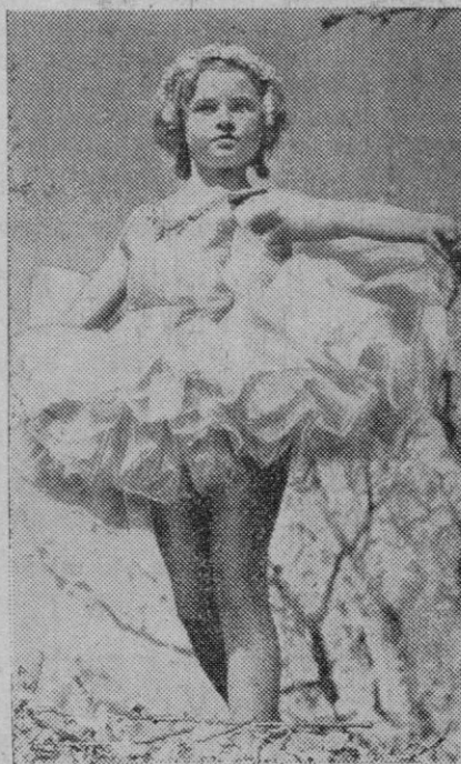
He aquí el hada de la Primavera de los cuentos simbólicos del Norte. Vaporosa, como una figura de ensueño que hace brotar las flores con su varita mágica; que es saludada por los pájaros con sus mejores trinos y que hace el milagro de convertir, bajo sus pies, el campo en una bendición de intensos verdores

Según el ejemplo de otras grandes naciones, en el futuro hay que respetar no sólo los derechos, sino también la voluntad de desempeñar un papel activo en la política europea.»—Faro.