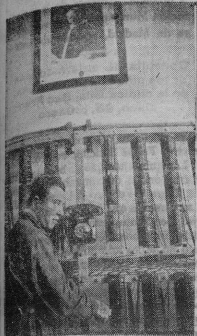
El grabado muestra una parte de la gran instalación telefónica del Vaticano, especialmente instalada por la Prensa, con ocasión de la elección del Papa. Sobre la pared se observa el retrato de Pío XI.