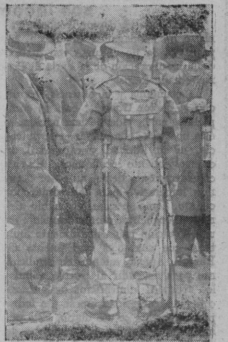
Los nuevos uniformes de campo del Ejército británico que, como se ve, se diferencian mucho de los antiguos uniformes, han sido recientemente presentados en Aldershot.