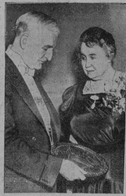
Mr. Hull recibiendo una condecoración. Suponemos que lo de Lima no le hará acreedor a otra distinción. De allí va a salir poco menos que con las manos en la cabeza

La Prensa de la Argentina opina con unanimidad que la alianza no es