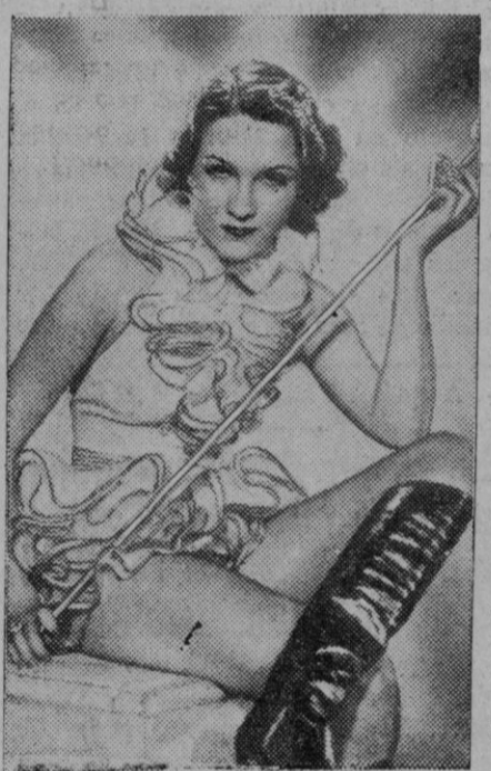
La popular estrella de la pantalla alemana, Vera Bergman, ha sido saludada por la crítica como la nueva Dietrich. Hay que admitir que su semejanza con la verdadera Dietrich es sorprendente