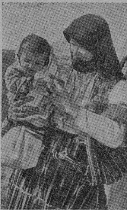
Yugoslavia celebra estos días su vigésimo aniversario. En la foto aparece una aldeana con su niño

ACTIVIDAD DE LA AVIACION.—En el día de ayer, nuestra Aviación bombardeó los objetivos militares del puerto de Barcelona, alcanzando muelles y depósitos, y produciendo incendios. Salamanca, 12 de Diciembre de 1938. Tercer Año Triunfal.