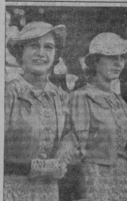
La bella princesa Tarozia (a la derecha), hermana mayor del Rey de Egipto, de diecisiete años, que es prometida del príncipe heredero del Irak. Está acompañada de su hermana la princesa Paiza, que dicen está prometida con un hijo del Rey Iba Saud

Las operaciones de limpieza han sido nuevamente emprendidas en la región de Naplus, donde las tropas británicas han detenido a 31 personas.