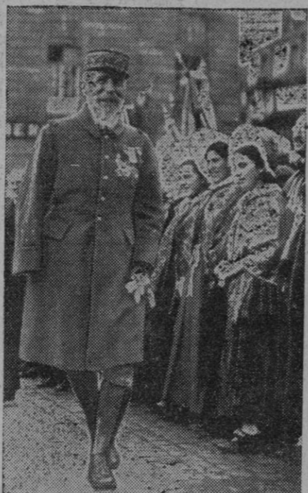
El veterano general Gouraud pasa revista a marciales soldados, sino a Ajaccio (Córcega), en cuya isla han tenido lugar demostraciones antitalianas con ocasión del XX aniversario de la entrada de las tropas francesas en Strassburgo después del armisticio

Estocolmo.—Se anuncia que aproximadamente 170 voluntarios escandinavos se encuentran en viaje de regreso a España, vía Dunkerque. El número de suecos que hoy en la España roja asciende a 87 muertos y además a 100 heridos suecos que están en los hospitales de Vitoria.