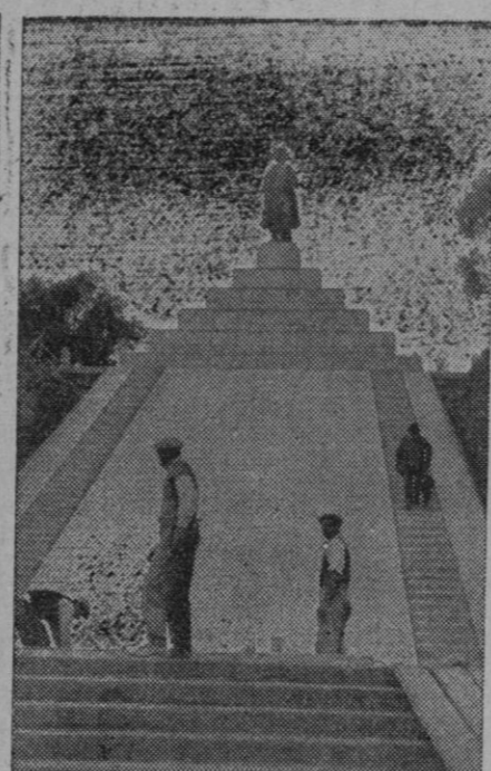
El monumento a Napoleón erigido en Ajaccio (Córcega), en cuya isla han tenido lugar demostraciones antitalianas con ocasión del XX aniversario de la entrada de las tropas francesas en Strassburgo después del armisticio