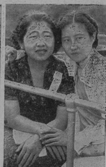
Una joven china y otra japonesa, que figuraban como delegadas de sus respectivos países en el Congreso mundial de la juventud, celebrado en América, se han hecho amigas, mientras que sus hermanos luchan en China