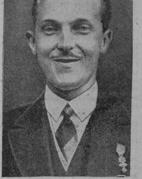
El ex príncipe de Asturias, conde de Covadonga

Este se produjo al pretender evitar el choque del vehículo con un camión