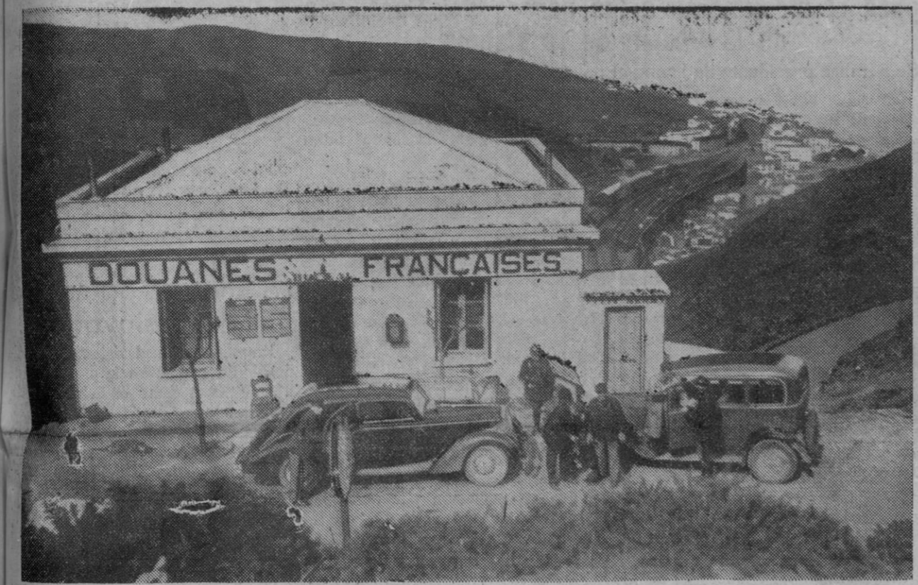
Insisten hoy desde Francia en que la frontera pirenaica con la España roja ha sido cerrada, hasta el punto de haber cesado en absoluto el tráfico. En todo caso ello no pasaría de ser un gesto político cuya trascendencia sólo puede apreciar el Gobierno del Generalísimo. Ahí aparece el puesto aduanero francés de Cervere, testigo mudo del tremendo crimen del Gobierno francés para con España que al Caudillo corresponde enjuiciar

Orden de suspender el envío de los barcos rojo-separatistas desde el golfo de Gascuña al Mediterráneo a través de los canales de Francia