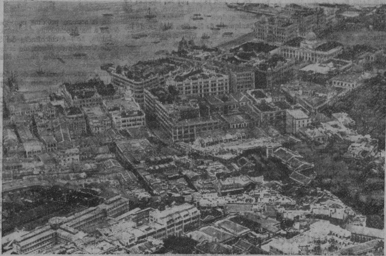
Vista aérea de Hong-Kong, cuya ciudad y zona piden los ingleses sea considerada neutral por los nipones en su ofensiva sobre Cantón

Este importante plan de construcciones navales se verá reforzado por una política de bases navales, es decir, poniendo en estado de máxima eficiencia las numerosas y excelentes que posee la nación italiana.