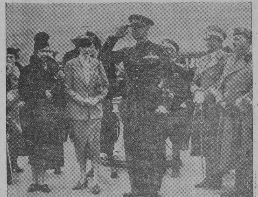
El duque de Aosta, nuevo virrey de Etiopía, fotografiado en el momento de salir de Nápoles para Addis Abeba. A su lado, la madre del duque y la princesa de Piemonte

Addis Abeba, 27.—A las once y cuarenta y cinco llegó al aerodromo de esta capital el avión conduciendo al duque de Aosta, nuevo virrey de Etiopía. Procedía del aeropuerto de Macallé, y le acompañaban el ministro de Obras públicas y otras personalidades.