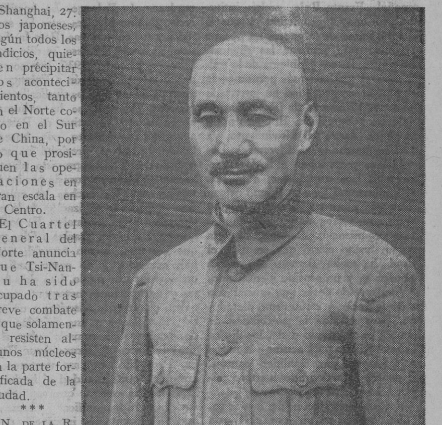
Shang Kai She, mariscal de las tropas chinas

Shanghai, 27.—Los japoneses, según todos los indicios, quieren precipitar los acontecimientos, tanto en el Norte como en el Sur de China, por lo que prosiguen las operaciones en gran escala en el Centro. El Cuartel general del Norte anuncia que Tsi-Nan-Fu ha sido ocupado tras breve combate y que solamente resisten algunos núcleos en la parte fortificada de la ciudad. *** N. DE LA R. Tsi-Nan-Fu es la capital de la gran provincia de Shan-Tung. Esta provincia de Shan-Tung ocupa una superficie de 145.000 kilómetros cuadrados, haciéndose ascender su población a más de cuarenta millones de habitantes. Desde luego es la provincia de mayor densidad de población de China. Los habitantes de Shan-Tung se dedican principalmente a la agricultura, la cual prospera mucho. En el Estado o Principado de Lu, incluido hoy en la provincia de Shan-Tung, nació el famoso filósofo chino Confucio. Por esta causa, la ocupación de la provincia de Shan-Tung por los japoneses ha de tener serias repercusiones en China.