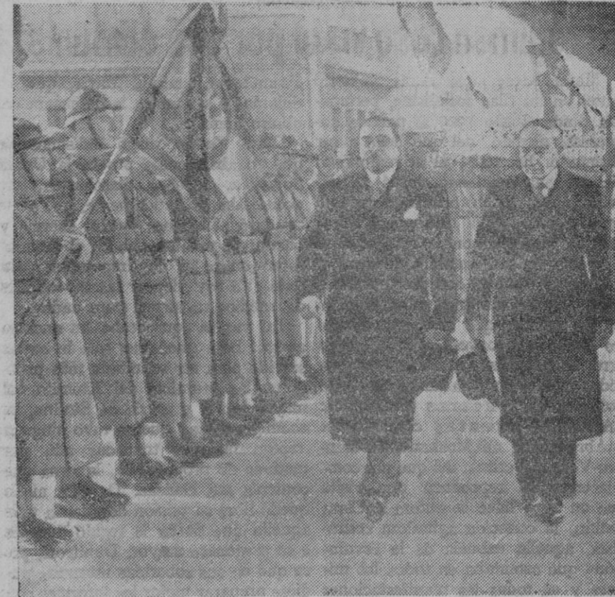
EL VIAJE DE DELBOS A BELGRADO.—El ministro francés, a la derecha, acompañado por el primer ministro yugoeslavo señor Stojadimowitch, revista las tropas que le rindieron honores a su llegada

El doctor Goebels pasará tres semanas en Egipto