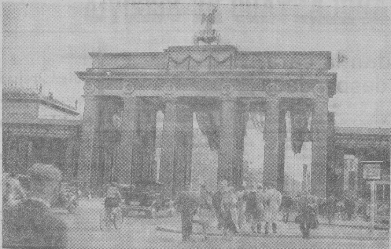
Durante los días 14 al 22 de Agosto, la capital alemana celebrará con grandes fiestas la fecha del aniversario de su fundación. Berlín es una de las ciudades más grandes y bellas del mundo. Cuenta con cuatro millones y medio de habitantes. La foto muestra el Brandenburger Tor, uno de los monumentos más notables de la capital alemana