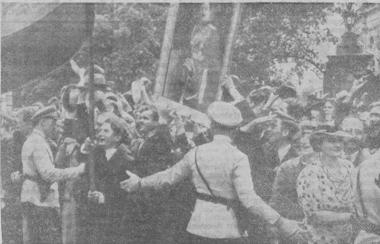
El nacimiento del heredero del Trono de Bulgaria ha dado motivo a que el país entero se entregue a demostraciones de júbilo. La foto muestra a los alegres habitantes de Sofía desbordando la Policía para poder rendir homenaje al futuro Rey

El presidente de la República de Georgia y 58 jefes comunistas destacados han sido detenidos y ejecutados