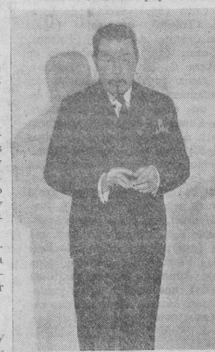
El célebre actor Warner Oland, que ha obtenido una gran popularidad con sus filmes «Charles Chan», es protagonista de la cinta «Charlie Chan» en la Olimpiada, que se está filmando