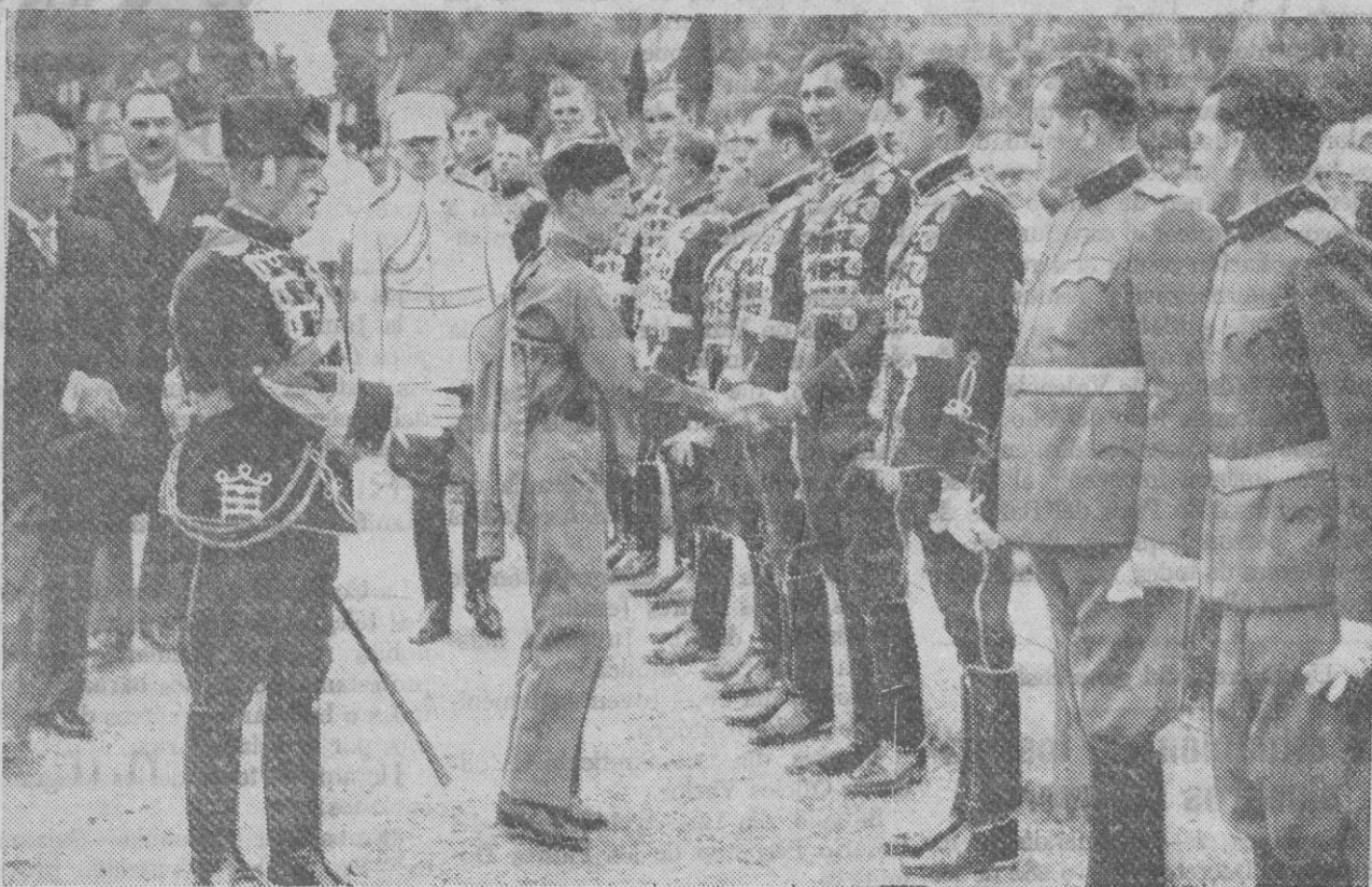
El joven Rey Pedro, de Yugoslavia, con el uniforme de su organización de la Juventud eslava, saludando a los oficiales pertenecientes a la guardia real durante una fiesta en Belgrado

Como es sabido, a consecuencia de dicho bombardeo resultó averiado un navío de guerra inglés, por lo cual el Gobierno de Inglaterra ha cursado al de Valencia una enérgica protesta.