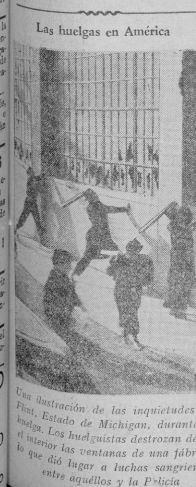
Una ilustración de las inquietudes en Flint, Estado de Michigan, durante la huelga. Los huelguistas destruyen desde el interior las ventanas de una fábrica, lo que dió lugar a luchas sangrientas entre aquéllos y la Policía

Para la fabricación de embutidos de buena calidad. Para partidas de importancia, consúltese precio CASA CANDIDO MENDOZA Cantimpalos