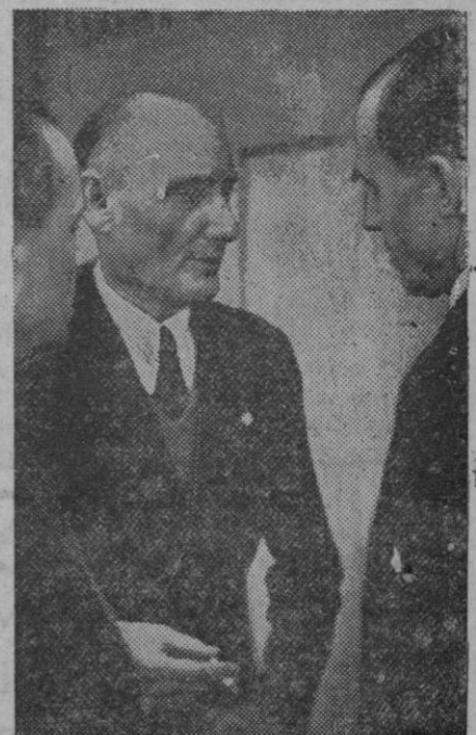
El barón Aloisi, jefe de la Delegación de Italia en Ginebra, conversando con otros delegados.

Es el marqués de Lozoya un verdadero aristócrata como escritor, como persona, por su noble proceder y por su artística sensibilidad, habiendo sabido, como el marqués de Santillana, dar lustre a su prestigioso apellido con tan excepcionales dotes.