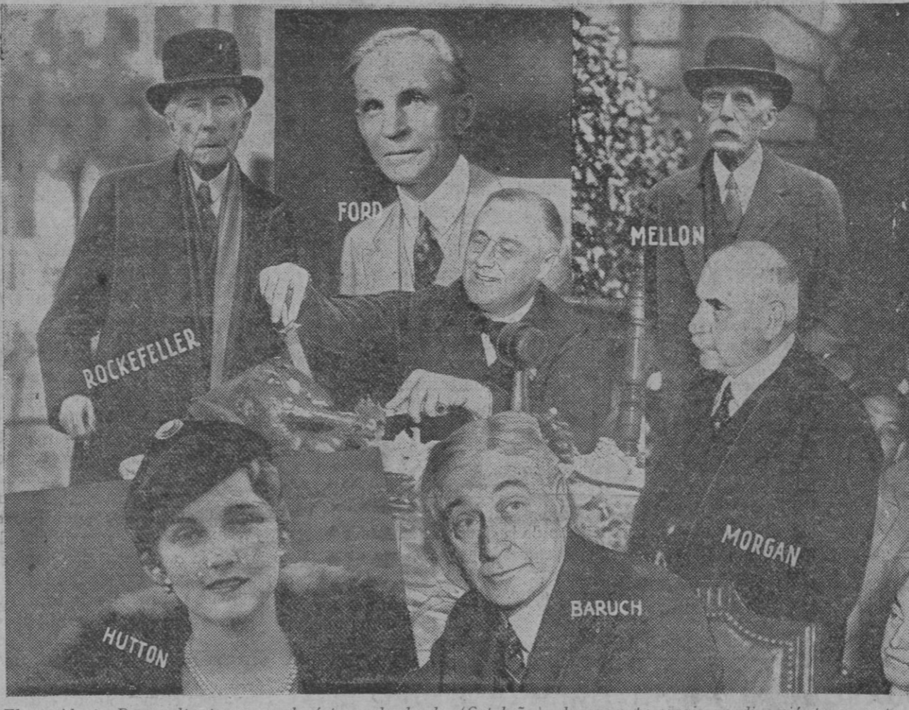
El presidente Roosevelt aparece en la foto, rodeado de algunos de los millonarios más conocidos de Norte América: Henry Ford, el rey de los "autos"; Jhon Rockefeller, el magnate del petróleo; el gran banquero Morgan, el antiguo ministro de Negocios Extranjeros, Mellon; el banquero Bernard Baruch y Bárbara Hutton, que ocupa el segundo lugar entre las más grandes fortunas del mundo, que heredó del fundador de los almacenes Noolworth, de Nueva Mayor. Por lo cual no quiere decir que mereció este triste fin; pero se lo parece mucho, según el comentario frío, salido de los labios de la mujer que le amó y que tan pronto olvidó acabó de morir en un accidente de automóvil en Albons para buscarle un sustituto.