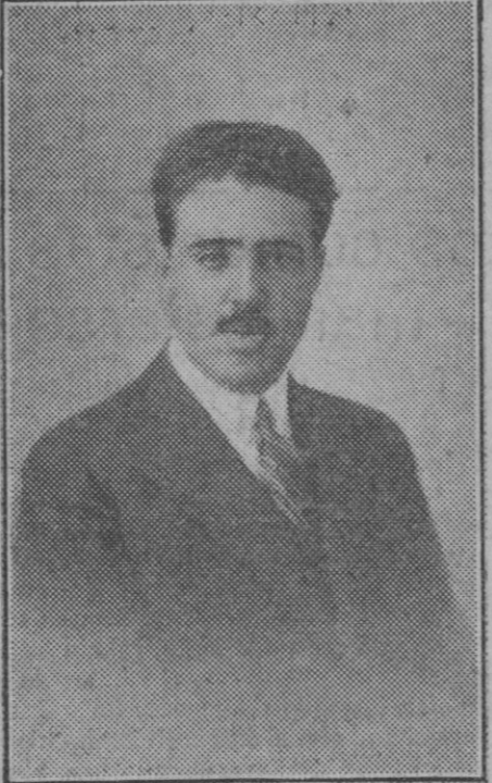
Don Juan de Contreras, marqués de Lozoya, nuevo cronista de la ciudad segoviana.