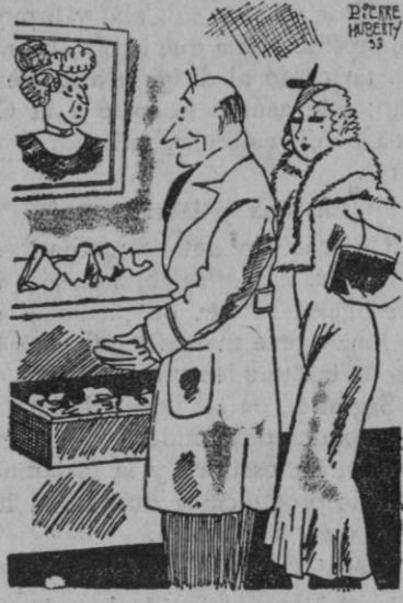
El.—Hemos sido robados por gente de buen gusto. Mira: han dejado el retrato de tu madre.

Madrid, 23.—El ministro de la Gobernación manifestó de madrugada que había sabido que el Ayuntamiento de Santander había tomado por mayoría de votos acuerdos relacionados con los proyectos de ley sobre