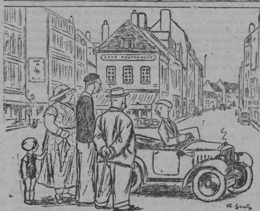
—¿Estás contento con tu coche? —¡Encantado! ¡Acabo de adelantar a un solo cilindro!