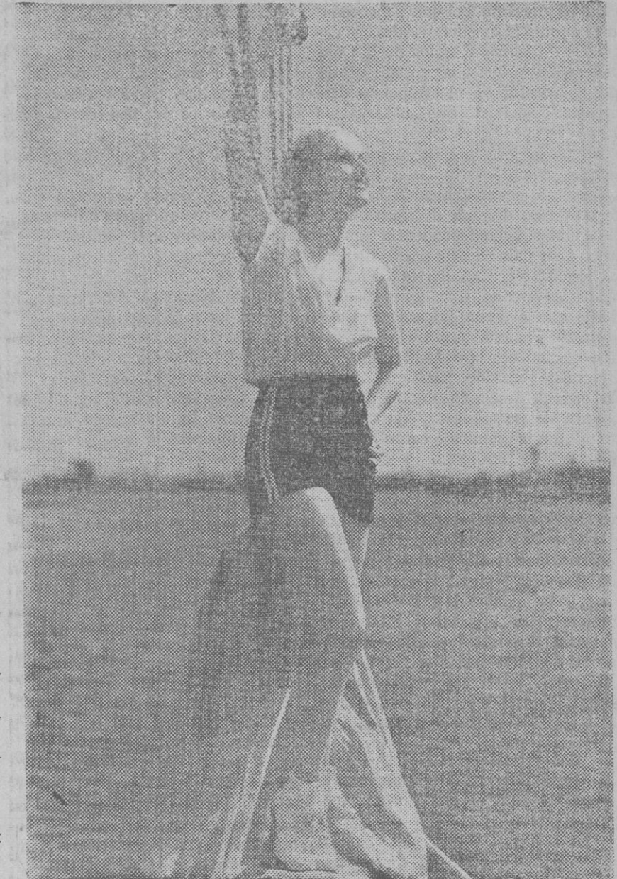
CAROLE LOMBARD en una pose de ensueño marino, que al ser recogida por la cámara cinematográfica, sugerirá a millares de espectadores la conveniencia de embarcarse.

Compra carne de cerdo a 40 pesetas los once kilos y medio. Este precio puede ser variable en días sucesivos