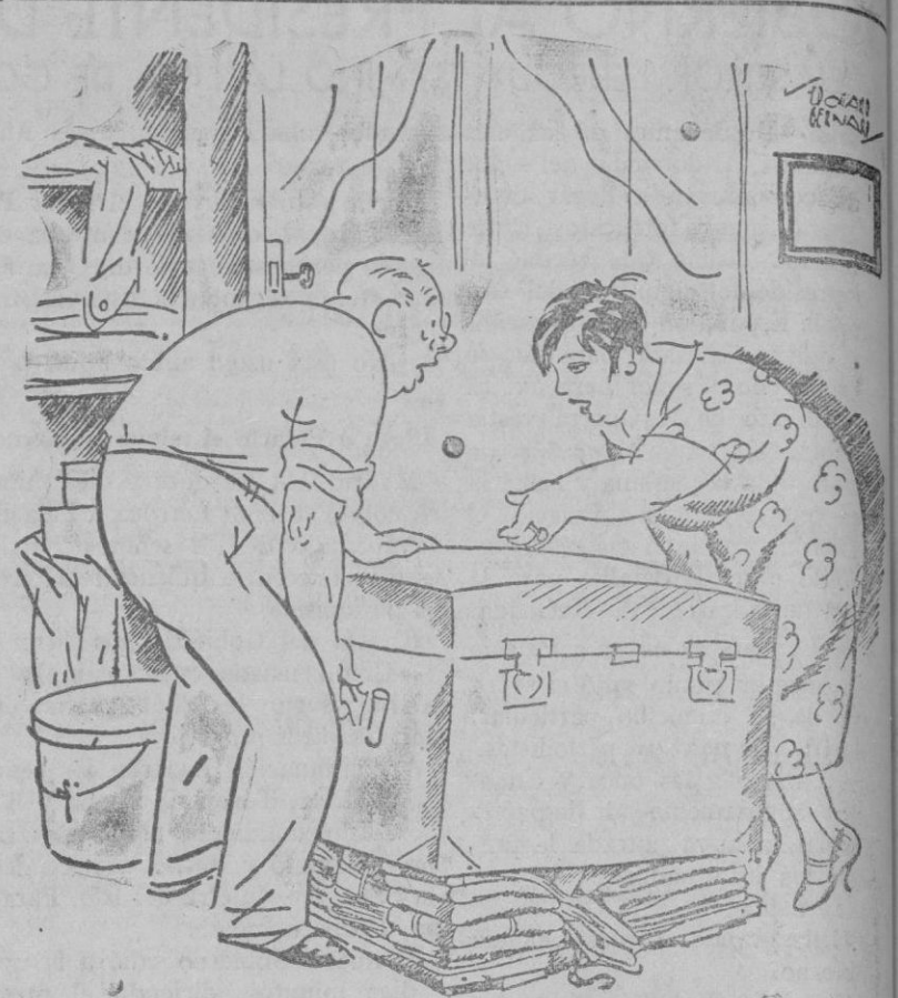
EL VERANEO —Pues, mira, pesa menos de lo que yo creía... —Ya te decía yo que podíamos meter más cosas.