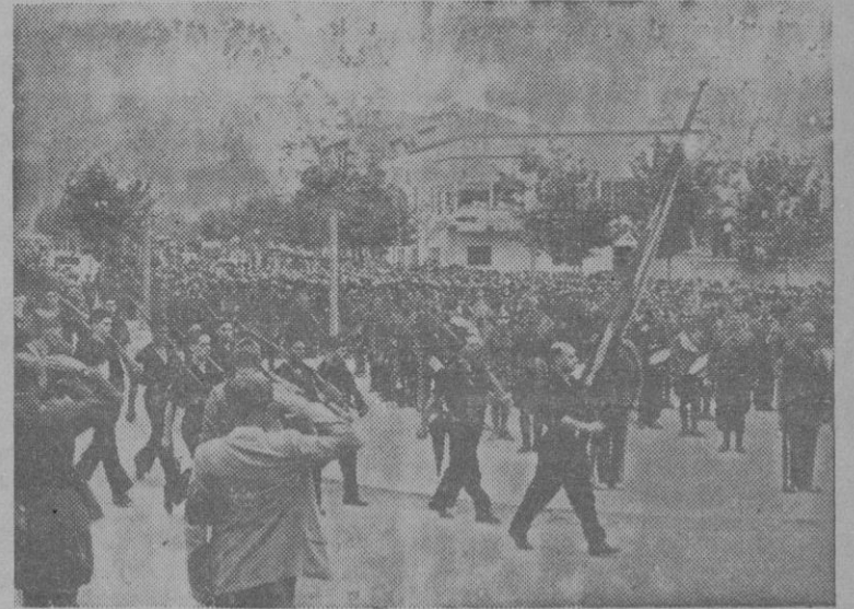
La Bandera de Falange