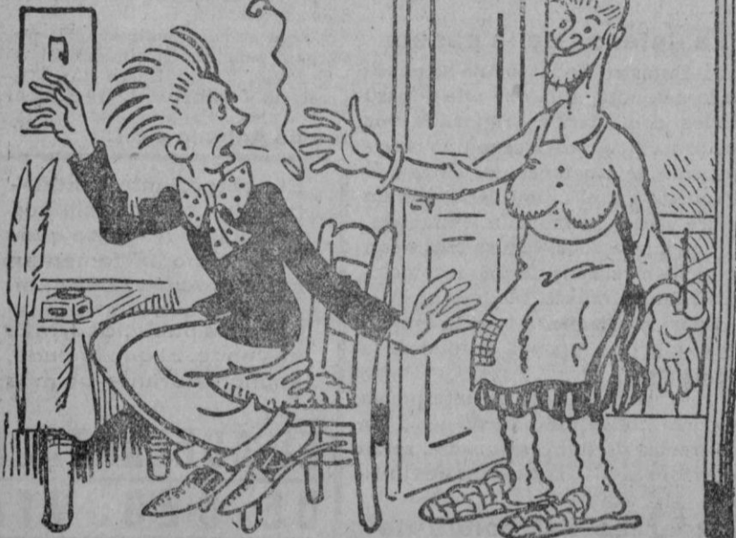
—Ven aquí a inspirarme, Musa alada, Musa bendita. —Aquí me tienes, yerno querido.