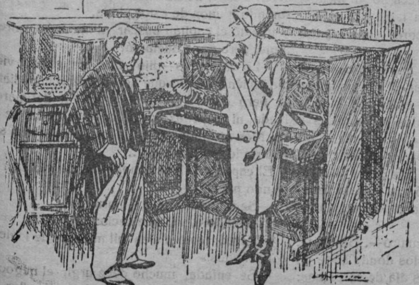
Como mi marido desea comprar un piano, tendrá usted la bondad de enviar unos cuantos como muestra a esta dirección?