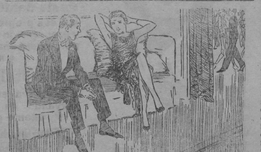
—Su familia se preocupa mucho de usted, amigo Basilio. —¡Oh, terriblemente! Todos los días me esperan en mi casa a la hora del almuerzo.