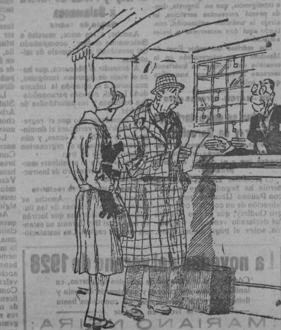
—Usted anuncia habitaciones de 50 y 100 pesetas y me cuesta 150. —50 y 100..., ¡justamente! ¿Quiere el señor hacer el favor de sumar?

El Pontífice Alejandro IV consagró por su bula en la Universidad de Salamanca, los estudios generales, con muchos y especiales privilegios. Alfonso VIII, de Castilla, terminó la conquista de Portugal. En heráldica, hay dos pabellos: el armiño y vero, que significan autoridad. Los «caballeros» sólo podían calzar «espuelas». Carlos I prescindió completamente de las Cortes, estableciendo un régimen absoluto. Fernando III el Santo favoreció y premió el desarrollo de la poesía, así como el arte dramático. Alfonso VIII, de Castilla, llevó a las Cortes la representación del pueblo. El «despeñamiento» y «descuartizaje» fueron penas terribles en la Edad Media.