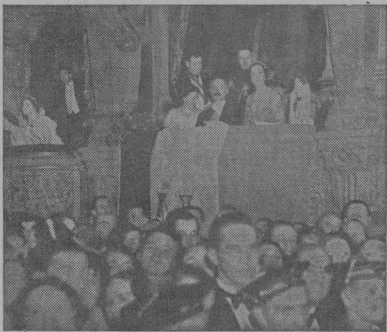
En la Opera de Paris ha tenido lugar una función de gala en honor de la marina francesa, asistiendo el señor Lebrun con su esposa y el Sr. Piétri, ministro de Marina. A la función asistió la más alta sociedad francesa.