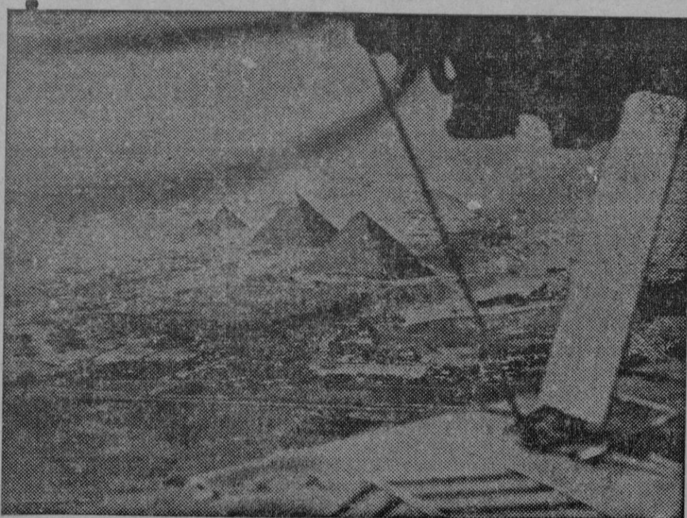
La fuerza aérea británica juega un importante papel en la defensa de Egipto, los observadores británicos han tomado esta preciosa fotografía.