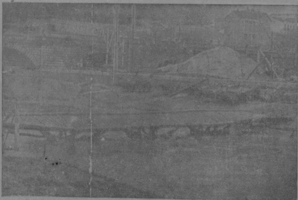
LA CRECIDA DEL MANZANARES.—El puente portatil que se ha colocado para poder vadear el Manzanares.

El número de nuestro teléfono es el 1745