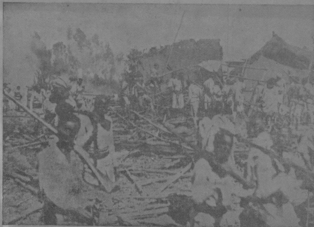
EL BOMBARDEO ITALIANO DE DESSIE.—Los indígenas entre los escombros de sus hogares, momentos después del bombardeo.