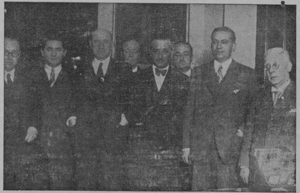
MADRID.—D. Jose M. Pemán en la Academia de Jurisprudencia.