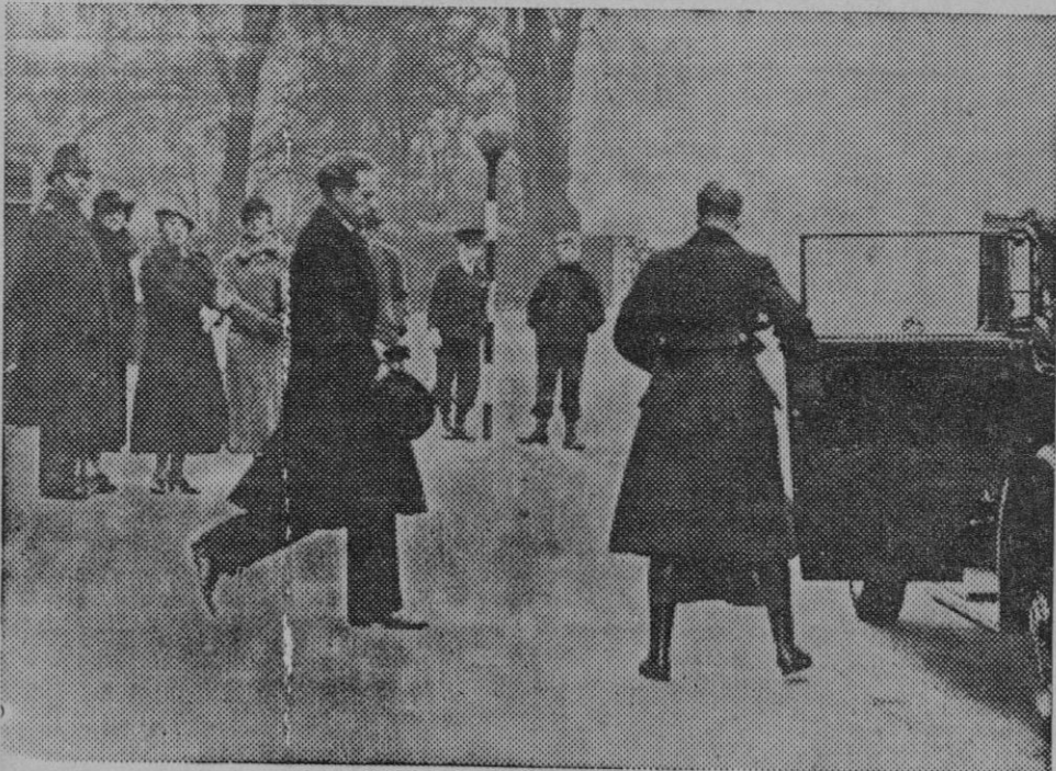
EL REY DE BELJICA EN LONDRES.—El Rey Leopoldo III de Bélgica que se encuentra en Londres en viaje de incognito visita a los soberanos ingleses en el palacio de Buckingham para darles el pesame por la princesa Victoria.