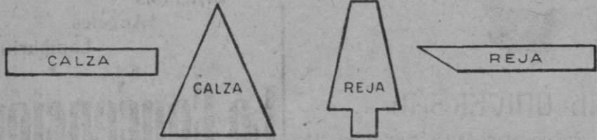
RECORTES Y PLETINAS PARA FABRICACIÓN DE HERRADURAS