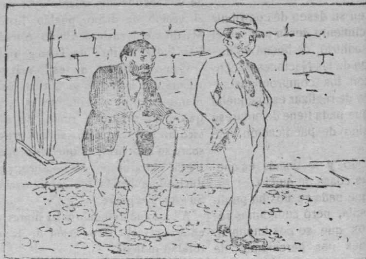
—Señorito, por Dios, deme usted un duro para ayuda de un panecillo —[Anda y que te lo de Rostchich!