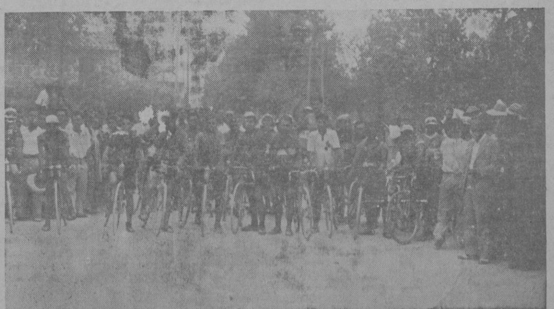
CICLISMO «GRAN PREMIO FORD».—Los corredores que tomaron parte en esta interesantísima prueba, momentos antes de darse la salida