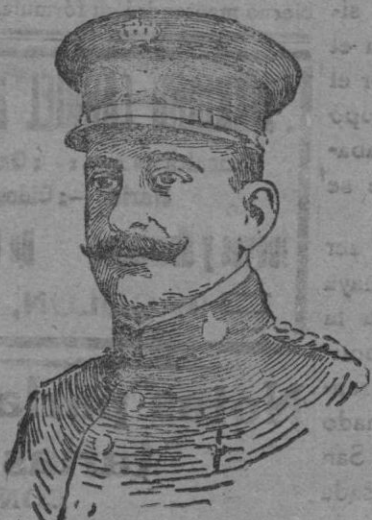
General Primo de Rivera y Orbaneja

que acaba de ascender a teniente general.