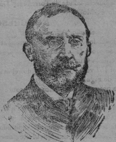
El Sr. Marqués de Figueroa, nuevo presidente del Congreso