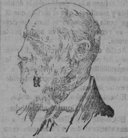
El ex rey de Babels, Othon I que se encuentra tan gravemente enfermo, que se teme un funesto desenlace.