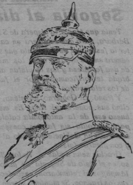
Leopoldo, José, Guillermo, Luis, Rey de Baviera.