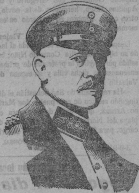
General alemán von Hutier

cándido famoso, al que por su valor y gran estrategia, le colocan entre los héroes más preeminentes del ejército alemán.